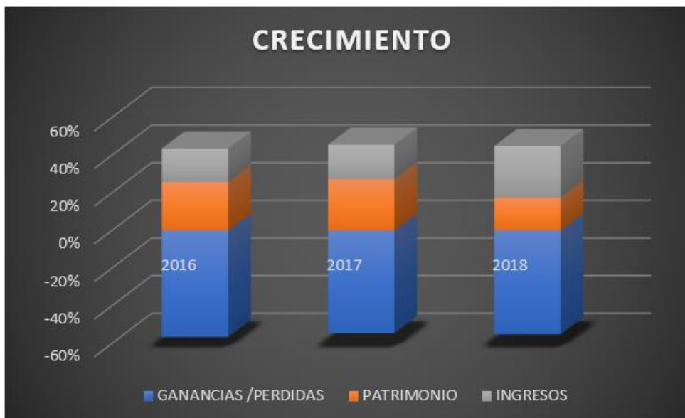
Figura 1: cifras de crecimiento