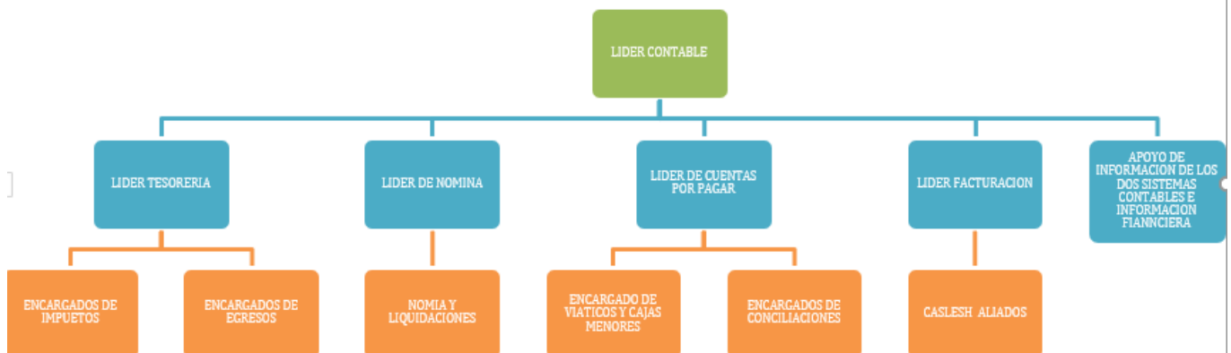
Tabla 3. Organigrama área contable.

Los encargados de realizar las funciones contables de la compañía son aproximadamente 14 los cuales tienen distribuidas las siguientes funciones para asegurarse de que todos los procesos contables de la compañía se realicen de manera eficaz: