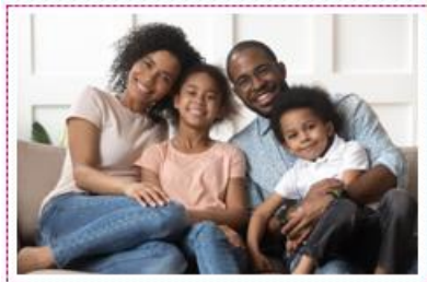
Conexión emocional con nuestros hijos.