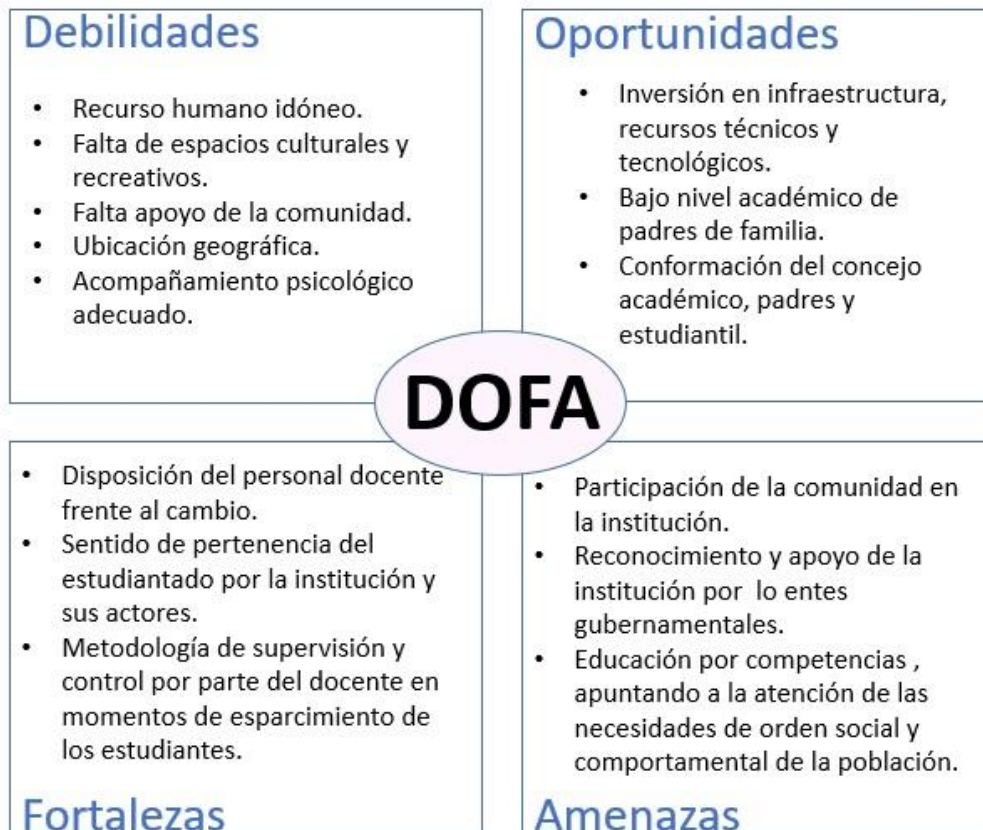
Ilustración Propia N°1, Matriz Dofa Institución Educativa Gilberto Álzate Avendaño.

Para el análisis de los factores internos y externos de la Institución Educativa Gilberto Avendaño Alzate, puntualmente aquellos que inciden en la efectividad de los procesos de enseñanza-aprendizaje como lo es el caso del ciberbullying escolar. Se utiliza la técnica de la ponderación del DOFA con la finalidad de detallar las debilidades, oportunidades, fortalezas y amenazas de la institución. En palabras de López (2004) es considerada una herramienta de gran utilidad para entender y tomar decisiones correctas, promoviéndose un marco de referencia para analizar todas las situaciones y procesos escolares.