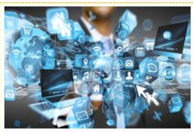
Prácticas vs Habilidades digitales.