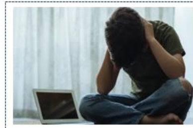
Ciberacoso Vs Apoyo sin culpas.

La propuesta del plan de mejoramiento considerado para la Institución Gilberto Álzate Avendaño, y con el cual se pretende responder a la pregunta: “¿Cómo el Ciberbullying puede afectar el sano desarrollo físico, mental y social de nuestros estudiantes y qué mecanismos podemos implementar para mitigar este tipo de conductas desde nuestro rol de docentes y padres?” entendiéndolo que, se trata de una problemática que involucra a todos los actores del contexto, y que de ellos pueden emerger acciones prácticas cotidianas y sencillas, con las cuales se puede mitigar o abolir la violencia escolar; y además que dichas acciones se convertirán en el ADN y por ellos serán parte de la cultura institucional.