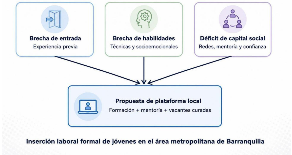
Figura 3. Modelo conceptual de las tres brechas de empleabilidad juvenil.