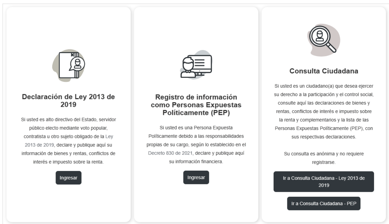
Imagen 1 Página principal del Aplicativo por la Integridad Pública – Consulta Ciudadana https://www.funcionpublica.gov.co/fdci/

Una vez dentro de la plataforma, el consultante encuentra una descripción del Aplicativo, el marco normativo aplicable y tres botones: Declaración de Ley 2013 de 2019, Registro de Personas Expuestas Políticamente y Consulta Ciudadana, que, a su vez, permite hacer la consulta de la Ley 2013 de 2019 y la consulta PEP. (Ver imagen 1)