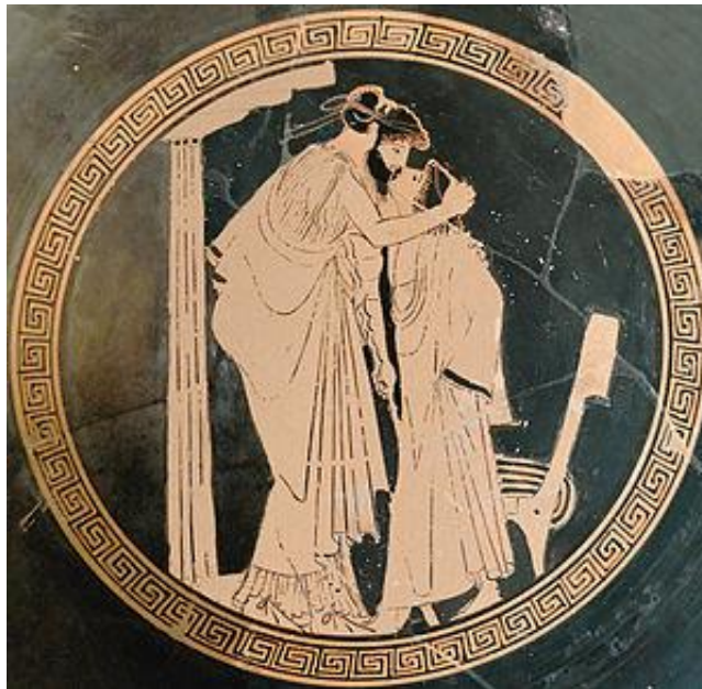
Ilustración 2. Joven erómeno con su erástes.

En su capital Atenas, la sociedad permitía protocolos con los que la unión de un hombre adulto y un joven adolescente como parte de un sistema educativo y social era normal, en el cual se le llamaba eraste al adulto que era el encargado de proteger, educar y amar a su joven erógeno quién le recompensaba con su pubertad, belleza y lealtad.