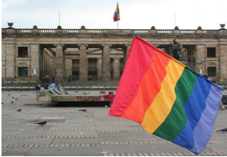
Ilustración 8. Símbolo del movimiento Gay