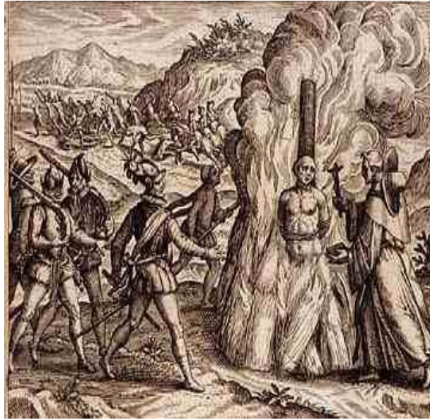
Ilustración 7. Castigo por sodomía