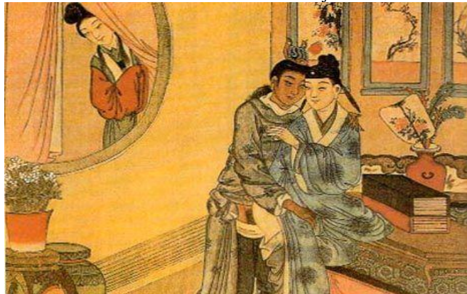
Ilustración 4. El sueño de la alcoba roja

En la literatura clásica de China también se encuentra la obra “El sueño de la alcoba roja o Historia de la piedra” donde la homosexualidad es mostrada con mucha naturalidad y sin ningún recato.