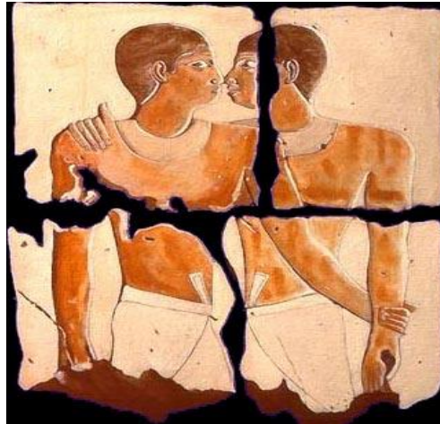
Ilustración 5. Los dos hermanos

relaciona con un hombre de nombre Semenkare con quien se le personifica en situaciones comprometedoras abrazándose o besándose.(Estevez, 2012)