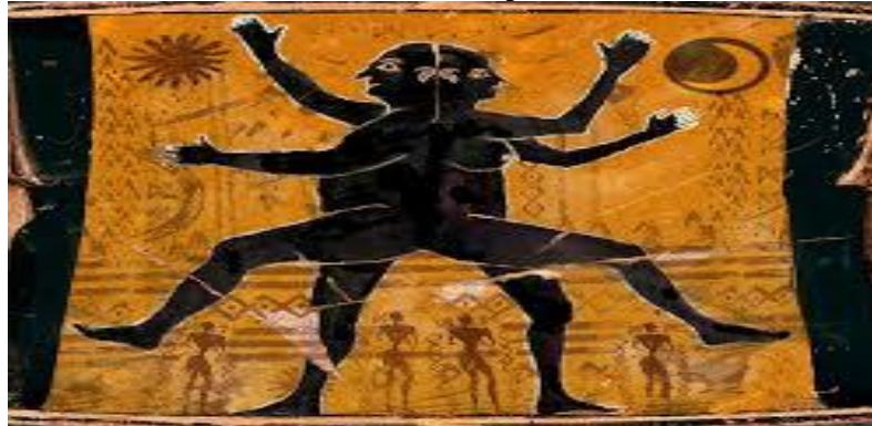
Ilustración 1. Mito Andrógino

la raza humana, porque era su adoración, los colocó en diferentes sitios de la tierra para castigarlos, y fueron condenados a buscar su otra mitad. Así se basaba la mitología para explicar el amor heterosexual; por eso según el mito el amor siempre trata de unirlos, de forma que cuando se encuentran se unen para toda la vida, uniéndose en una sola persona. Cada mitad del hombre y de la mujer antigua se entregaban a la homosexualidad en busca de su otra mitad, en cambio la mitad del andrógino se va en la búsqueda de su heterosexualidad, conformado por hombre y mujer.