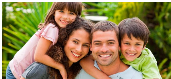
Ilustración 10. Ejemplo de familia nuclear

Es la familia clásica conformada por madre, padre y los hijos.