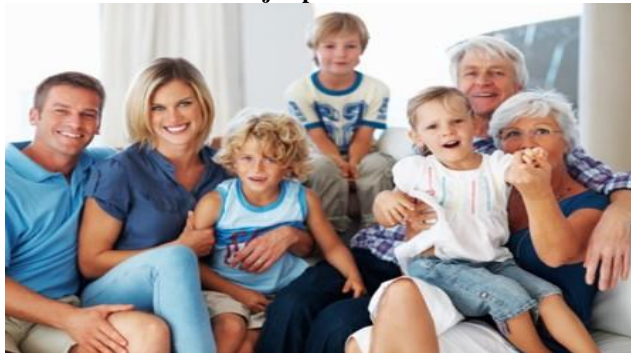
Ilustración 11. Ejemplo de familia extendida.

Es la que está conformada por parientes cuyas relaciones no son únicamente entre los padres e hijos, es decir puede incluir consanguíneos o afines.