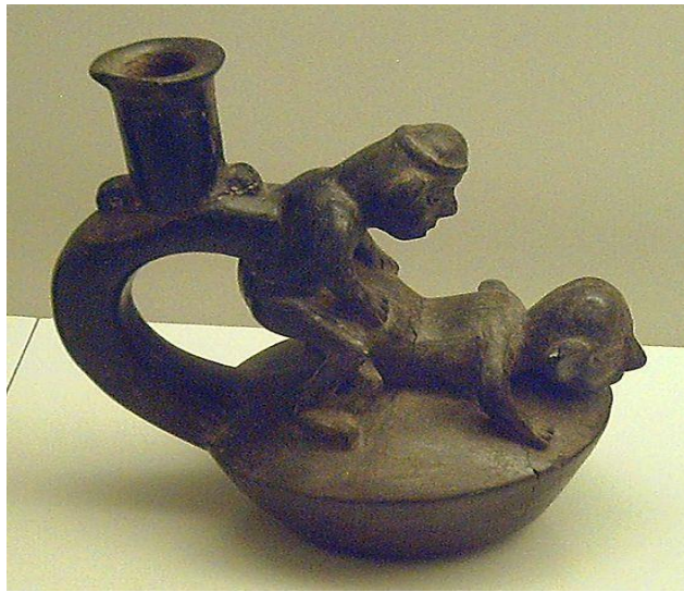
Ilustración 6. Pieza precolombina donde se muestra a dos hombres en acto homoerótico.

En las costas de Venezuela como en las de Colombia, para sus culturas indígenas la homosexualidad era aceptada, en el museo de oro de Bogotá, el Rufino Tamayo de Oaxaca y el museo de arte precolombino de Chile, podemos encontrar una gran variedad de huacos y cerámicas, en donde se ve representados actos de homosexualidad entre los guerreros.