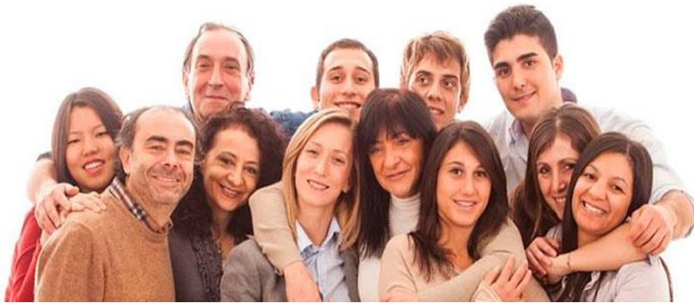
Ilustración 9. Familia

“La familia, según la Declaración Universal de los Derechos Humanos, es el elemento natural y fundamental de la sociedad y tiene derecho a la protección de la sociedad y del Estado”. (16, 2015).