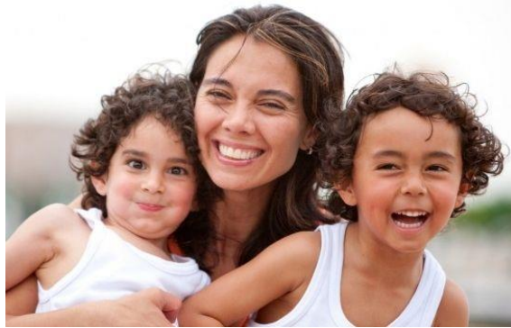
Ilustración 12. Ejemplo de familia monoparental

Está conformada solo por uno de sus padres.