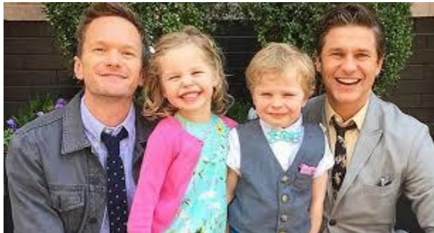
Ilustración 13. Ejemplo de familia homoparental

Formada por una pareja homosexual y sus hijos biológicos o adoptados.