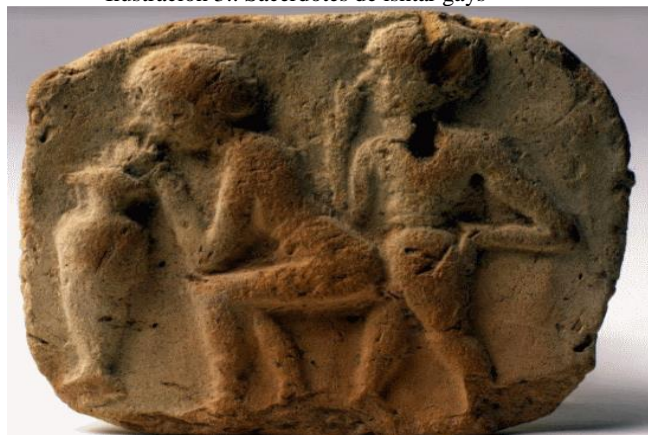
Ilustración 3.: Sacerdotes de ishtar gays