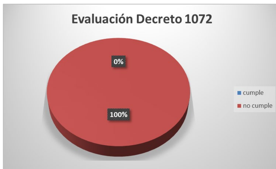
Figura 3. Evaluación Decreto 1072 de 2015.