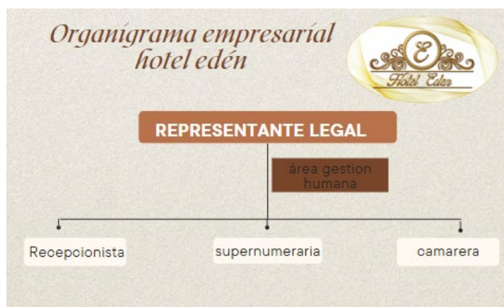
Figura 1 Organigrama de la empresa hotel edén