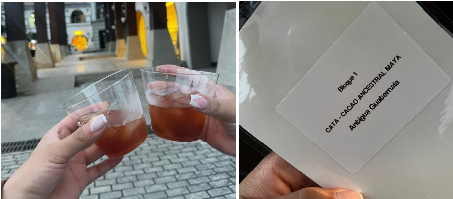
Figura 3. Cata de cacao ancestral.

Nota: Las imágenes representan la cata correspondiente al licor de cacao y cacao ancestral.