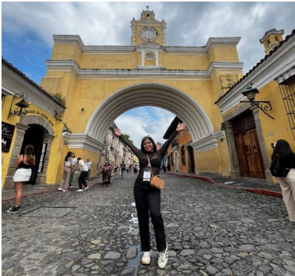
Figura 5. Arco de Santa Catalina en Antigua Guatemala.

Nota: La Imagen representa, la visita al reconocido arco de Santa Catalina, donde se pudo apreciar su estructura y conocer la historia del lugar.