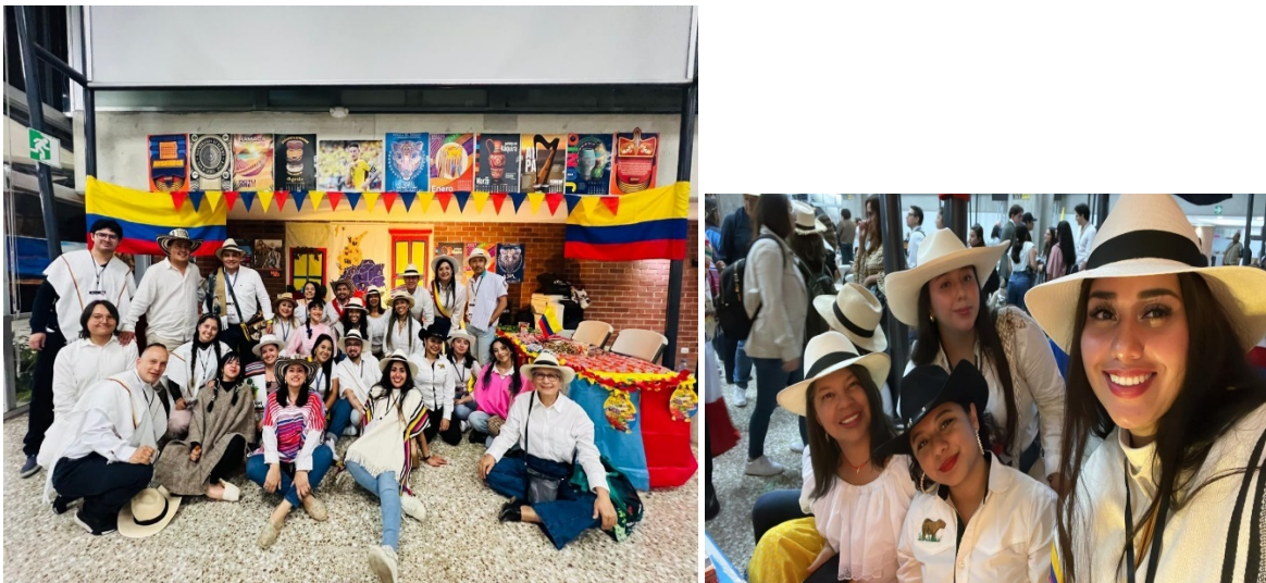
Figura 3. Noche Panamericana, stand de Colombia.

Nota: Las imágenes representan el stand realizado por los participantes de Colombia en el congreso de CONPEHT, noche panamericana.