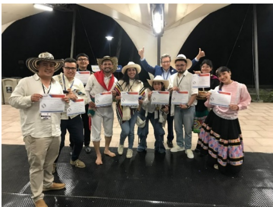
Figura 6. Certificación AHLEI.

Nota: La imagen representa el grupo de estudiantes que realizaron la certificación AHLEI (American Hotel & Lodging Educational Institute) para fortalecer su carrera profesional.