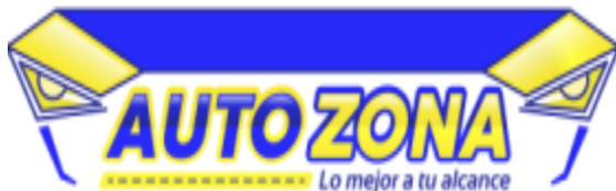
Figuras 1 Logo de la organización