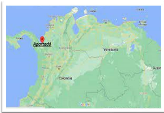
Figura 1. Mapa

Nota. Ubicación del hotel en Google mapa