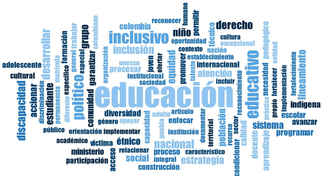
Ilustración 4. Nube de palabras, análisis documental con software MAXQDA