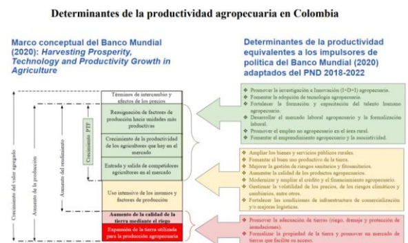
Figura 2. determinantes de la productividad agropecuaria en Colombia, después de ser ajustada de acuerdo a las recomendaciones hechas por la OCDE. imagen: (Parra et al, 2022, p.10).

En las medidas salubres, se resalta que Colombia a través del INVIMA y el ICA son los encargados de llevar a cabo todos los controles sanitarios, remarcando que los productos frescos solo requieren un registro del ICA sin necesidad de trámites ante el INVIMA, además de que el ICA es el encargado de cualquier trámite a nivel de importación de insumos agrícolas (OECD/OCDE, 2015).