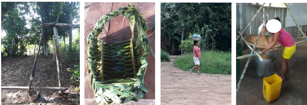
1. Sebucán 2. Katumare 3 Rol de la mujer Piapoco 4. Cernidor

Email: crisj9006@gmail.com / crpineda2@poligran.edu.co