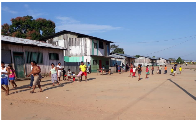
Arriba. Viviendas típicas calle principal Guaco bajo

A pesar de encontrarse en una zona considerada como violenta, en la actualidad, en el resguardo no hay vestigios de grupos armados al margen de la ley ni oficiales, a pesar de que estos grupos contrario a lo que muchos piensan generaban desarrollo económico en la región, además de mejores condiciones de vida para los habitantes, sin desconocer que algunas de estas actividades eran ilícitas.