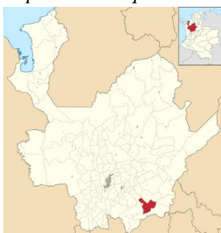
Mapa de Antioquia

Nota: Ubicación del municipio San Francisco en el mapa de Antioquia.