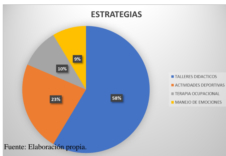
Ilustración 2 Estrategias

Respecto a las creencias de cómo se debe trabajar con alumnos con TDAH, la mayoría de los profesores concuerda que se debe realizar un seguimiento especial a las actividades asignadas, así como llevar un proceso personalizado que genere confianza bajo un enfoque de inclusión en el cual se puede afianzar las relaciones interpersonales. A su vez un profesor refiere que se debe trabajar con mayor ahínco con estos estudiantes sin embargo considera que la atención no debe dirigirse en gran proporción hacia ellos.