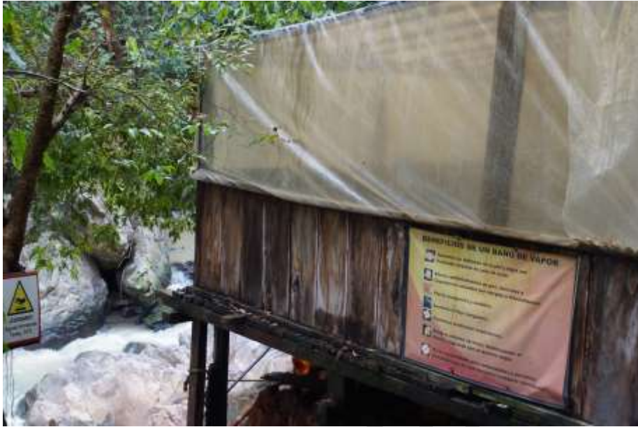
Fotografía: Paola Liliana Falla Villa, 2014

El piedemonte llanero, el cual es su región biogeográfica, en donde el bosque húmedo tropical se mezcla con ecosistemas de bosque maduro intervenido, bosque secundario avanzado y bosque de piedemonte acoge a visitantes y locales para seducir con su paisajismo y convertirse en un destino recomendado para lograr esparcimiento, recreación, salud y bienestar.