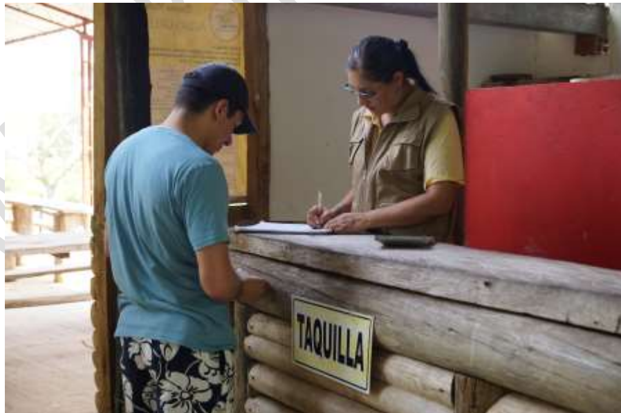
Fotografía: Paola Liliana Falla Villa, 2014