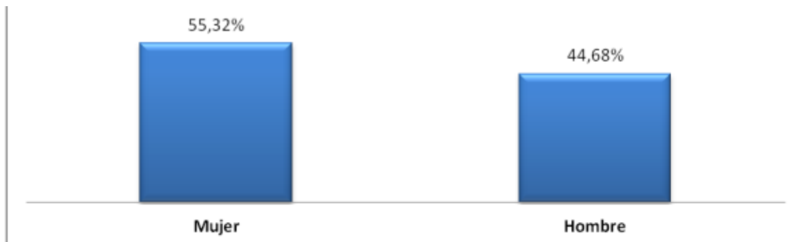
Gráfica 2: Población de Buenaventura en situación de pobreza extrema por sexo