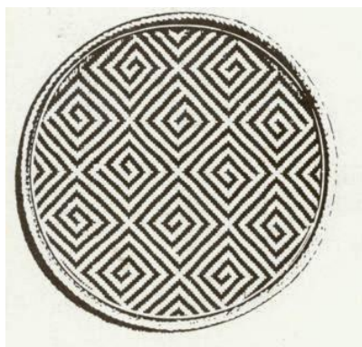
Ilustración 3 Artesanía Guapa

Guapa: objeto utilizado para la decoración o guardar objetos.