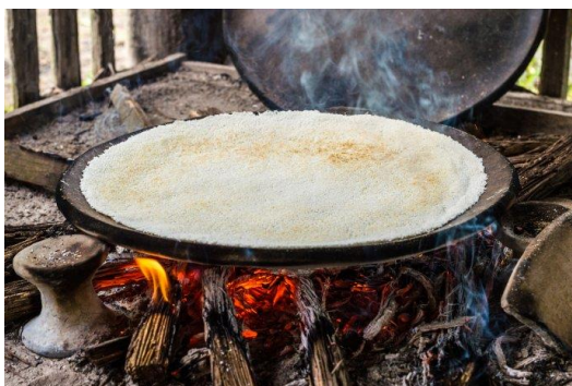
Ilustración 7 Budare

Budare: herramienta utilizada para fabricar el cazabe y mañoco