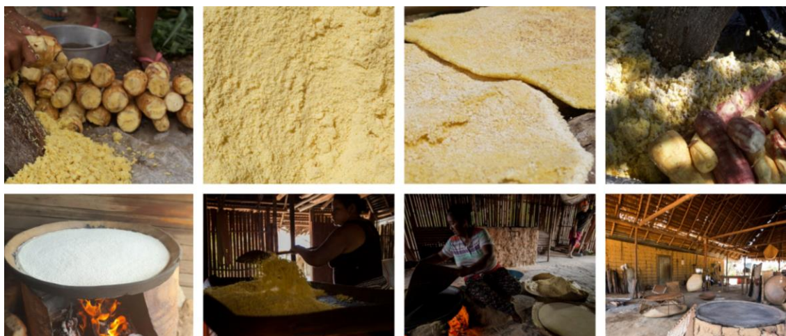
Ilustración 2 Correspondiente al proceso de elaboración del cazabe y mañoco

El mañoco y cazabe: es un alimento granulado o en especie de tortilla que se produce de la yuca brava o amarga, bajo un proceso manual, cierta cantidad de yuca brava se deja en el agua por cuatro días, para que se ablande y otra cantidad se raya, se extrae todo el zumo, utilizando el sebucán, herramienta que realiza la extracción del zumo, después de este proceso se pila hasta obtener un harina bien fina, después de este proceso se utiliza un cernidor para sacar ciertas impurezas, seguidamente se hecha cierta cantidad al budare para hacer el mañoco o cazabe.