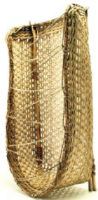
Ilustración 5 Katumare

Catumare: cesto utilizado especialmente para el transporte de la yuca brava.