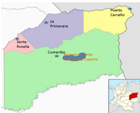
Ilustración 1 Mapa de Vichada, Ubicación del resguardo Santa Teresita del Tuparro