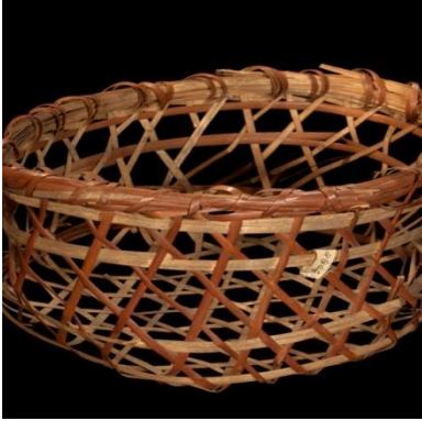
Ilustración 4 Artesanía Mapire