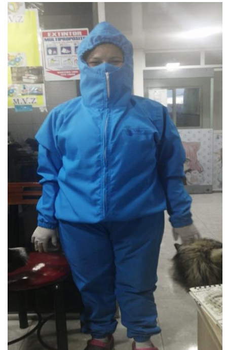
Empleada de la clínica veterinaria Veterok con su dotación de EPP

Todos los trabajadores de la clínica veterinaria Veterok P.C cuentan con sus elementos de bioseguridad además de eso, la clínica comenzó a manejar turnos rotativos con sus empleados para evitar tanta aglomeración de personas en la clínica. Para la atención de los pacientes solo puede ir una persona con la mascota y debe portar tapabocas, guantes y lavarse las manos al momento de ingresar a la clínica veterinaria, de no hacer caso a estos requerimientos no se podrá atender a la mascota si el dueño incumple, deben tener cita agenda (excepto las emergencias).