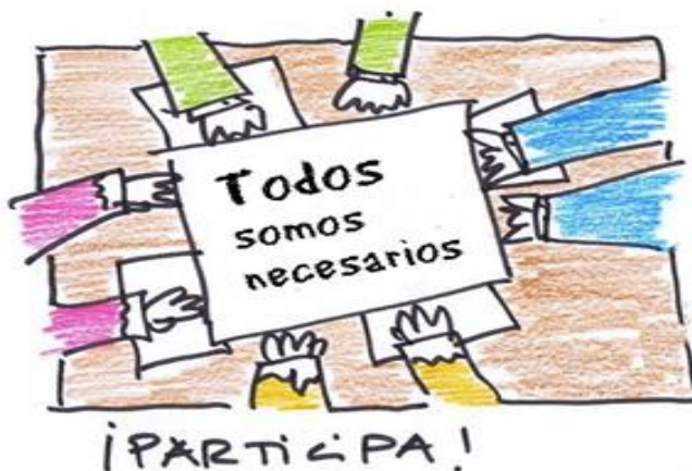
Ilustración 3. Todos Somos Necesarios