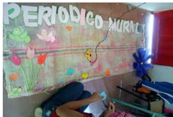
Ilustración 5. Periódico Mural.