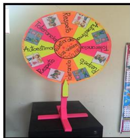
Ilustración 7. Ruleta de los valores.

Vamos a realizar la ruleta de los valores, un grupo de estudiantes va a colorear las imágenes que está lleva, otros van a colorear la ruleta con vinilo, y otros van a escribir los valores a trabajar, después se girara la ruleta y depende del valor que quede, este se debe explicar en grupos de tres estudiantes, diciendo lo que entienden sobre esa palabra. Ejemplo: Si la ruleta cae en el valor del respeto, deben explicar que entienden por dicho valor.