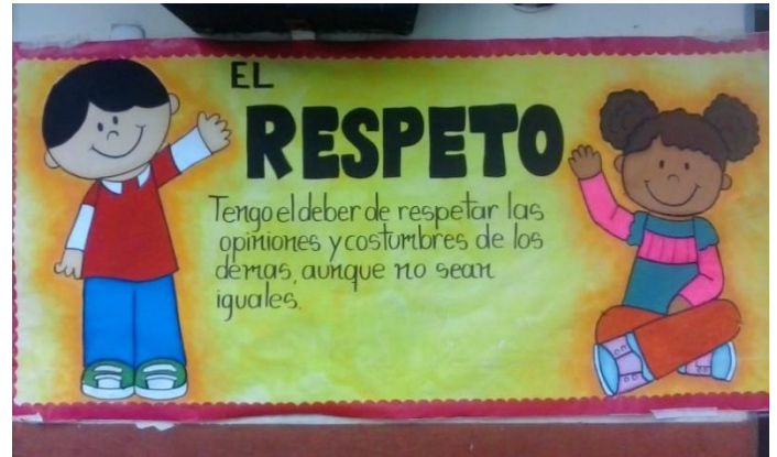
Ilustración 8. Grafiti Sobre los Valores

Escribe en tu cuaderno de Ciencias Sociales un cuento de cómo crees que sería un mundo sino hubiera respeto. Luego, realiza un grafiti (Es una pintura libre que se escribe y se dibuja con un fin artístico) con una frase sobre la importancia de un mundo con valores.