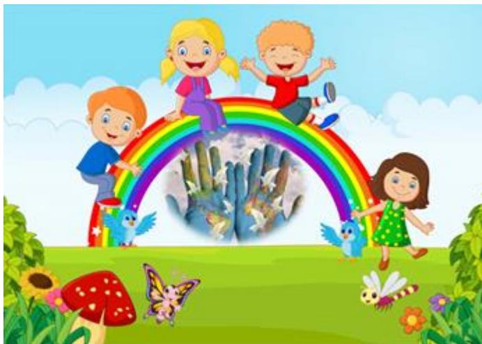
Ilustración 6: La Paz Enseña a los Niños a Convivir