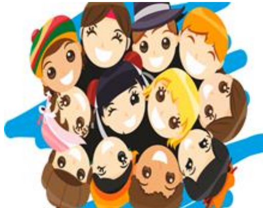
Ilustración 2. Convivencia Escolar