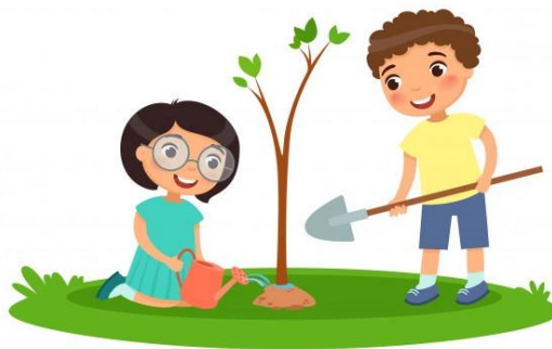
Ilustración 9. Sembrando Valores