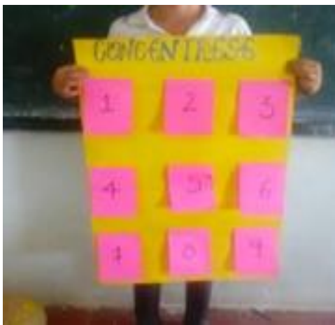
Ilustración 10. Concéntrese. Fotografía tomada por la autora