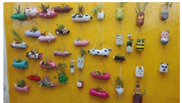
Ilustración 11. Materas en Material Reciclable