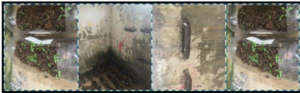
Ilustración 12. Huerta Escolar.

Posteriormente, los estudiantes van a exponer sus macetas, explicando por qué le pusieron ese nombre; comprometiéndose a fortalecer dicho valor.