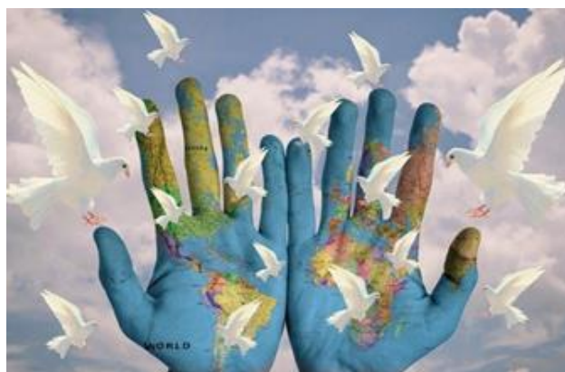
Ilustración 5. Cultura de paz