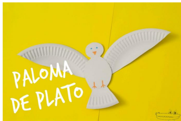
Ilustración 4: Manualidad paloma de la paz