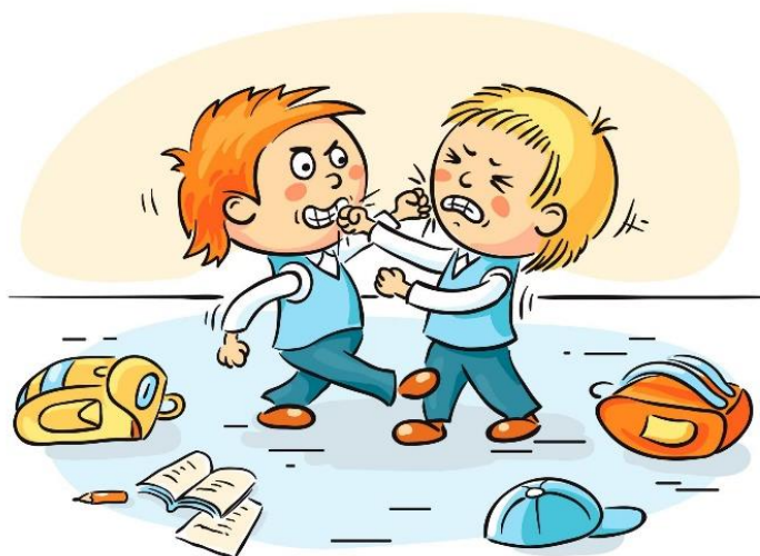
Ilustración 13. Resolución de Conflictos.