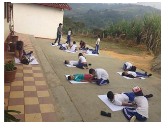
Ilustración 3. Silueta de la igualdad.

La actividad consiste en organizar a los estudiantes por parejas en el patio, se les entregará un pliego de papel bond, para que dibujen la silueta de su compañero, luego ellos deberán exponer las siluetas reconociendo que todos somos iguales y tenemos las mismas cualidades, resaltando los valores del compañero que dibujaron.