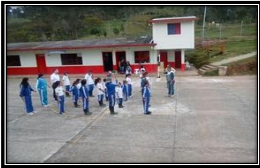
Ilustración 1. Centro Educativo Rural Mallarino

Temporalización: Esta unidad está diseñada para realizarse en cinco sesiones, cada sesión tiene una duración de una hora aproximadamente.