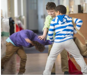
(Figura 2. Matienzo, G., 2018. Qué hay detrás de los niños que hacen bullying)