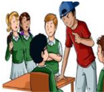
(Figura 4. Setién, M., 2017. Protocolo de actuación en caso de acoso escolar)