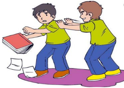
(Figura 6. Godoy, C., 2013. El fracaso escolar II)

Seguido a ello deben responder si alguna vez han recibido este tipo de tratos, y que tipo de soluciones creen ser viables para solucionar este tipo de conflictos.