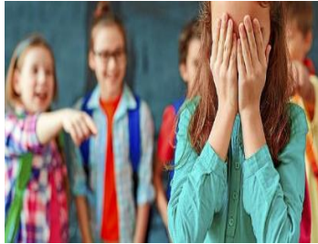
(Figura 3. Nekane, L., 2020. Bullying: las tristes secuelas mensajes del acoso)