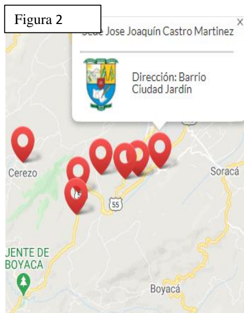
Figura 2. Dirección Sede JJCM

https://www.google.com/maps/place/Institucion+Educativa+Rural+Del+Sur+--+Baron+Germania/@5.5010482,-73.3660533,328m/data=!3m1!1e3!4m5!3m4!1s0x8e6a809d6f845485:0xbef6b817e1c9b31!8m2!3d5.4921219!4d-73.40417