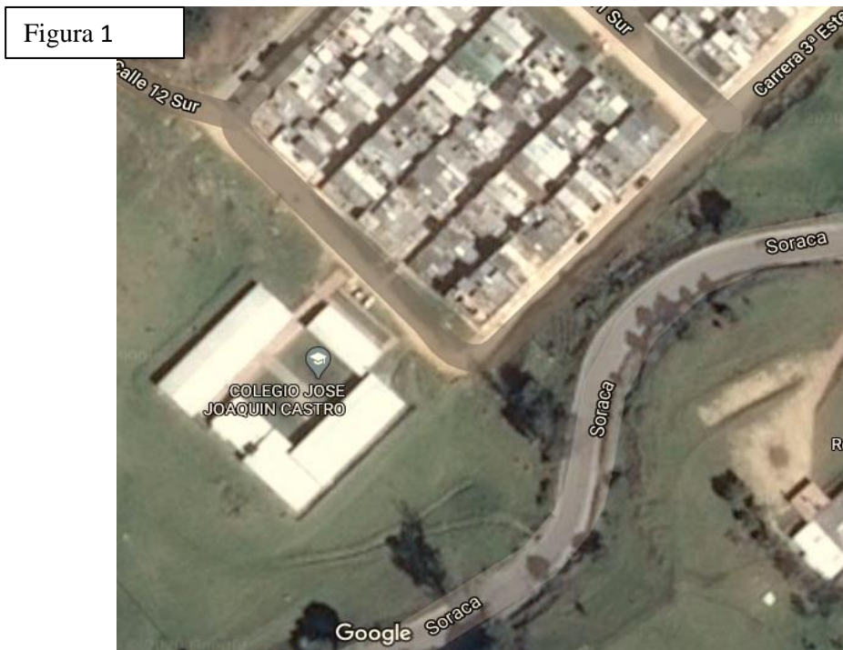
Figura 1. Imagen de ubicación de la sede JJCM recuperado de

https://www.google.com/maps/place/Institucion+Educativa+Rural+Del+Sur+--+Baron+Germania/@5.5010482,-73.3660533,328m/data=!3m1!1e3!4m5!3m4!1s0x8e6a809d6f845485:0xbef6b817e1c9b31!8m2!3d5.4921219!4d-73.40417