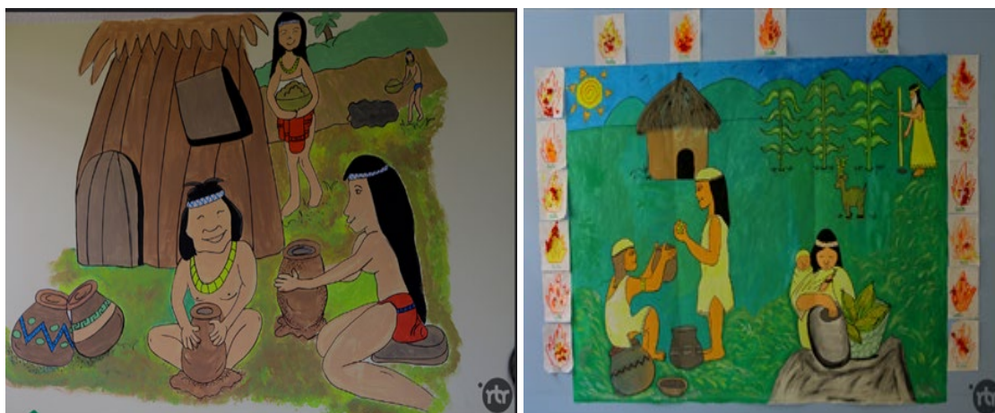
Ilustración 4. Dibujos representativos.