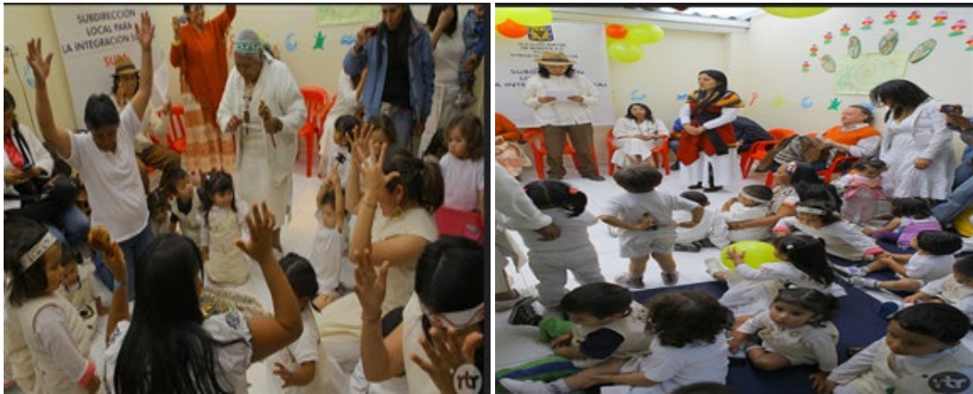
Ilustración 1. Danza ancestral.