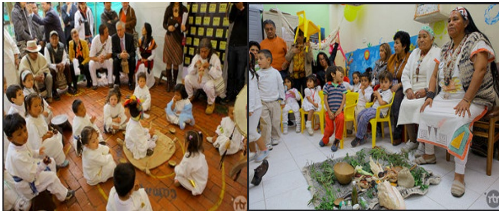
Ilustración 2. Instrucciones y elementos representativos.