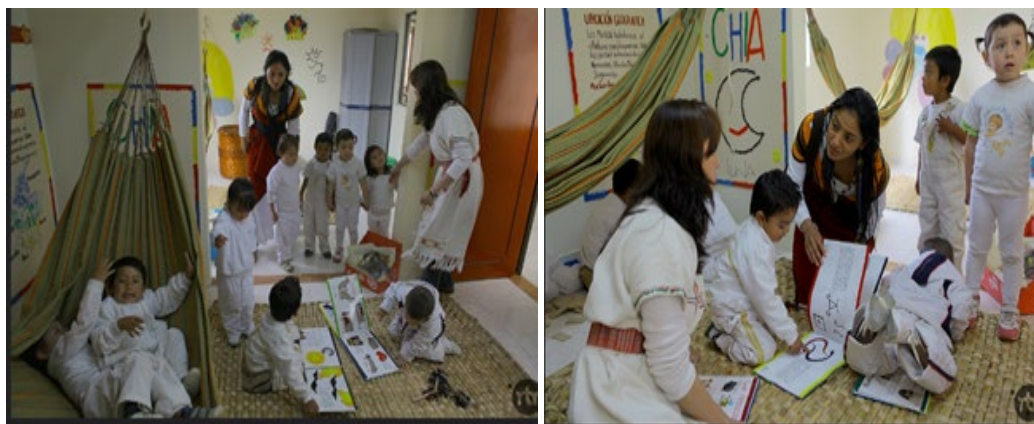
Ilustración 3. Actividad de video, dibujos.