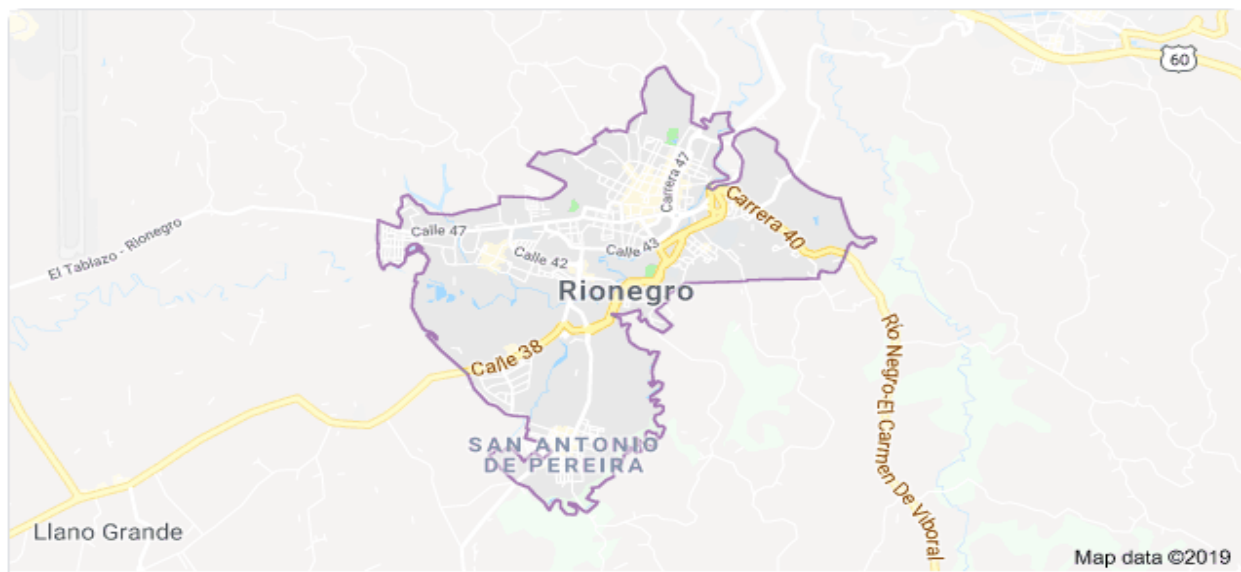
Figura 2. Ubicación de Rionegro.

La temperatura promedio en el casco urbano de Rionegro es de 18.5 grados C. Es un clima relativamente frío (-mínima registrada: 16 grados centígrados. -máxima registrada: 22 grados centígrados.) (Rionegro, 2020)