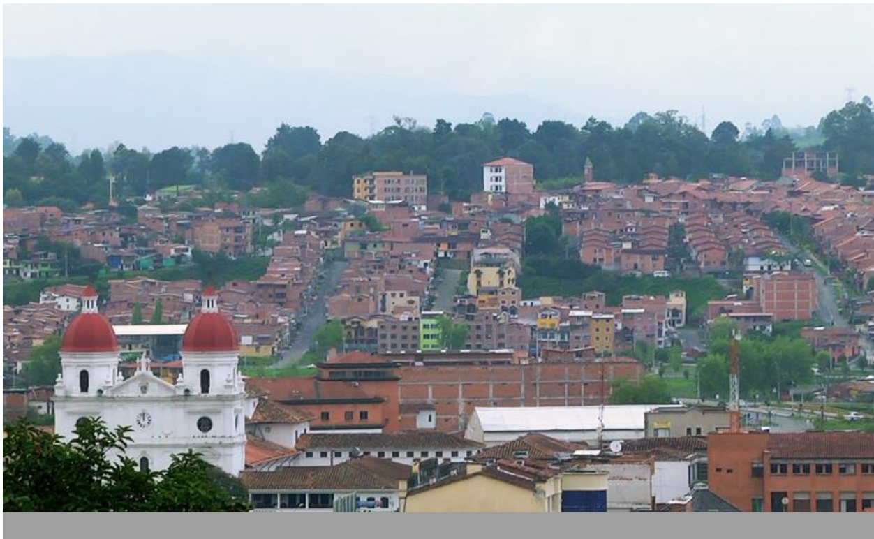
Figura 6. Periferia Rionegro. Fuente: DiariOriente. 2017.