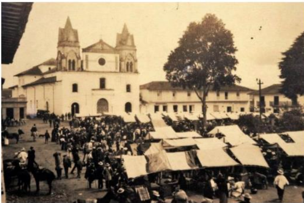
Figura 4. Batalla de Cascajo-Rionegro.

Se conserva como una reliquia la Casa de la Convención, lugar en donde según registros históricos, fue redactada la Constitución de 1863, la Constitución de Rio Negro, lugar que hoy pertenece a los bienes de la nación, en manos del Ministerio de Cultura, como bien público de interés general. (Tierra Colombiana, 2020)