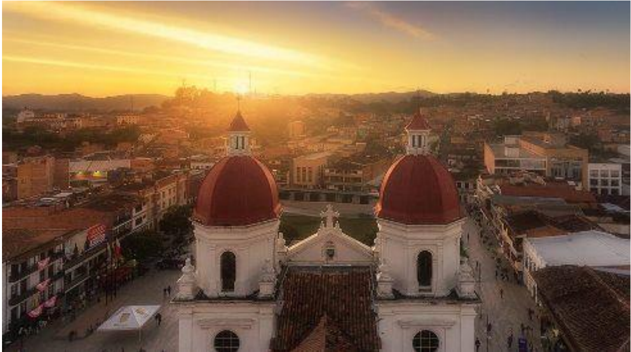
Figura 5. Vista de Rionegro. Junio. 2019.

Desde el punto de vista del aspecto ambiental en el municipio de Rionegro, el informe de gestión ambiental presentado en el año 2017 señala los aspectos favorables del clima del municipio y de la notable favorabilidad de su arquitectura colonial, la cual enriquece y contribuyen de manera satisfactoria al diálogo entre la arquitectura y el medio ambiente.