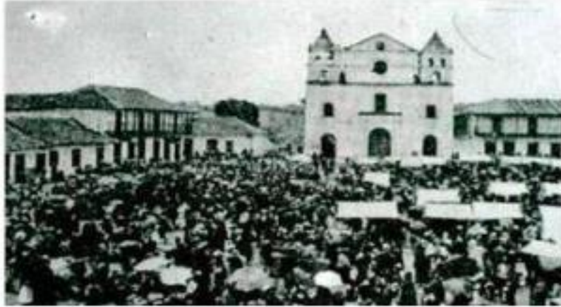
Figura 1. Imagen de Rionegro en el año 1888. Fuente Anuario Estadístico 2016.

Rionegro es el centro del desarrollo empresarial del Oriente Antioqueño. En estos años la actividad económica ha pasado por varias etapas, desde la titulación inicial en el siglo XVI, hasta lo que es hoy, una ciudad con actividad industrial, comercial y de servicios.