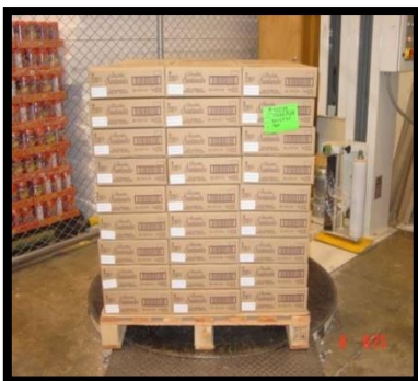
Ilustración 4 - Embalaje Consolidado