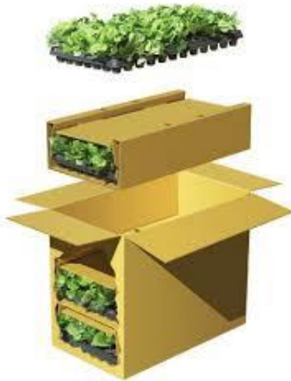
Ilustración 3 - Empaque Cannabis para Exportación

Las cajas iniciales serán guardadas y agrupadas en una caja mas grande donde se apilarán de tres cajas en una, como se muestra la imagen; esto con el debido cuidado de tener en cuenta la refrigeración y el paso del aire entre cada una, para esto se empleará una división entre cada caja de cartón corrugado para que haya fluidez de aire.