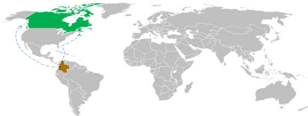
Ilustración 1 - Vías Marítimas de Acceso a Canadá