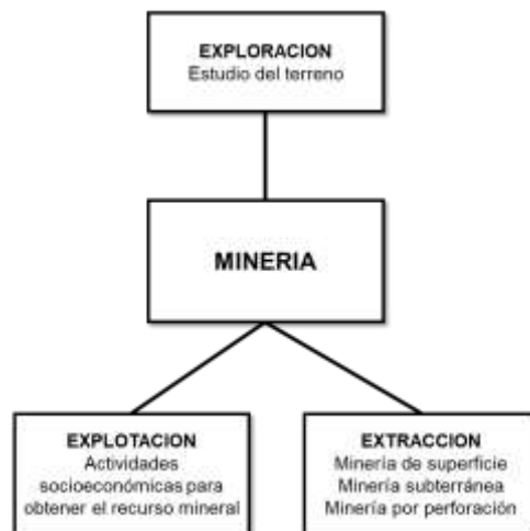
Figura 1. Etapas de proceso productivo de una mina. (Ministerio de Salud, 2015)

En Colombia la minería está reglamentada por la Ley 685 de 2001 (Ministerio de Salud, 2015). En la labor minera se destacan 3 fases: la exploración, la extracción y la explotación (ver figura 1). En la primera se despliegan trabajos, estudios y labores necesarias para instaurar las reservas y lugar del mineral, la geometría del almacén, en esta fase se investiga y se deduce técnicamente las existencias del mineral, los almacenes o depósitos; así mismo la preparación del plan minero, la ejecución de las metodologías y equipos de extracción y duración de la posibilidad de la producción deseada. En la etapa de la extracción, su nombre lo muestra se extrae la roca desde la mina para ser transportada a su procesamiento; esta extracción es realizada por dos métodos dependiendo de cada mina: subterránea y a cielo abierto, los subprocesos primordiales de esta etapa son la perforación de la roca y la carga del material a su destino. Finalmente, la etapa de explotación, en ella hallamos todas las acciones socioeconómicas para conseguir el mineral; entre ellas está el grupo de procedimientos, labores y tareas mineras predestinadas a la elaboración y progreso del yacimiento, y al transporte del mineral a su sitio de procesamiento.