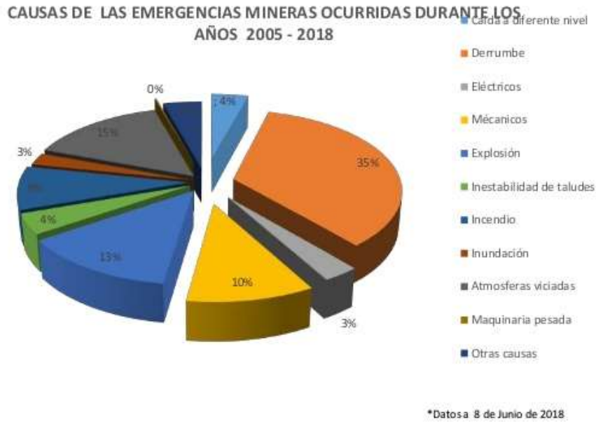
Figura 2. Causas de las urgencias sucedidas durante los años 2005 - 2018. Fuente: ANM. 2018