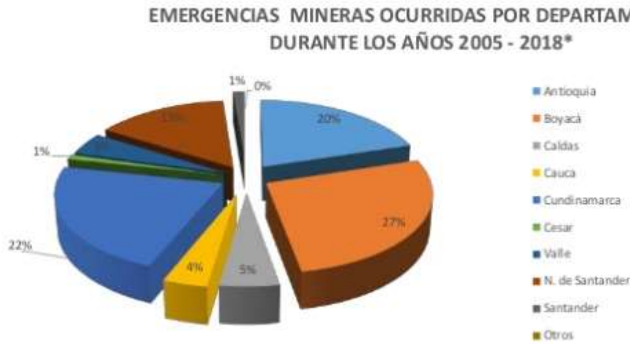
Figura 4. Urgencias mineras sucedidas por departamento durante los años 2005 – 2018.

Esta indagación igualmente evidencia que los departamentos que puntan los registros de mayores accidentes son Antioquia y Boyacá que, a su vez, tienen una alta cuantía de Unidades Productivas Mineras (UPM). Antioquia tiene un 20% durante los años 2005 al 2018 y Boyacá un 27% durante los mismos años. Así mismo en este reporte presenta las ocurrencias mineras sucedidas durante el mismo periodo por el modelo de minería, es decir, bajo tierra o a cielo abierto.