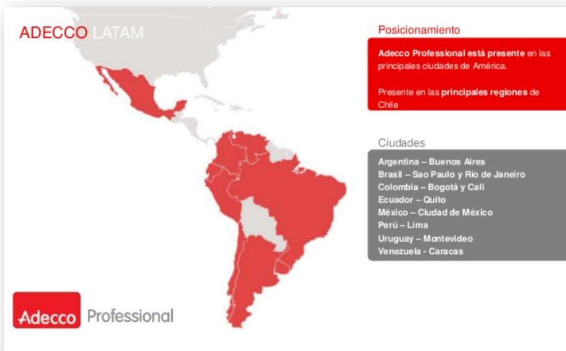
Imagen N°2. Adecco en Latinoamérica