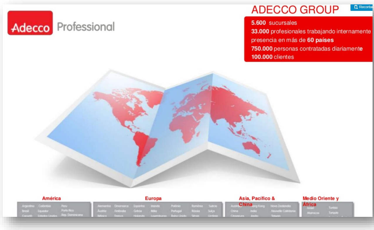
Imagen N°1. Adecco en el mundo