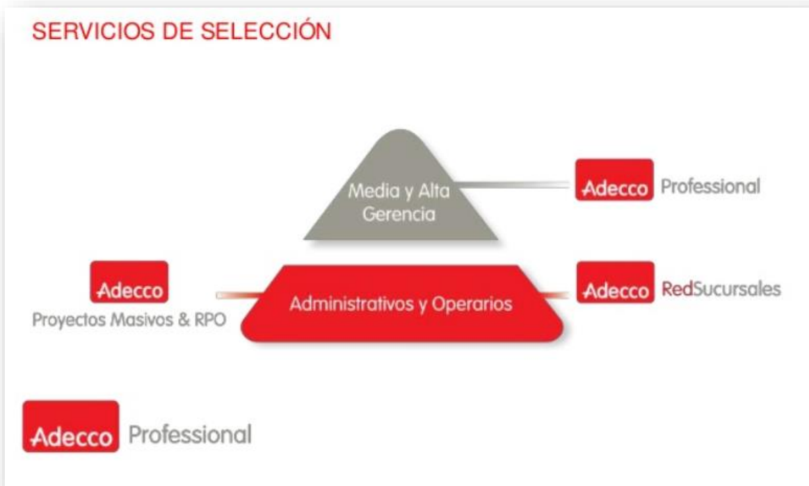
Imagen N°3. Servicios de selección