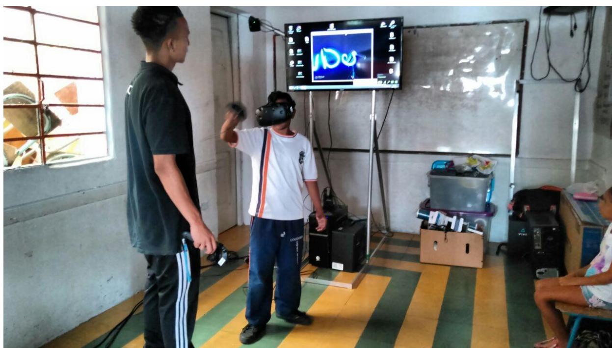
IMPLEMENTO LAS TIC EN LA CONVIVENCIA ( Julio 2017)