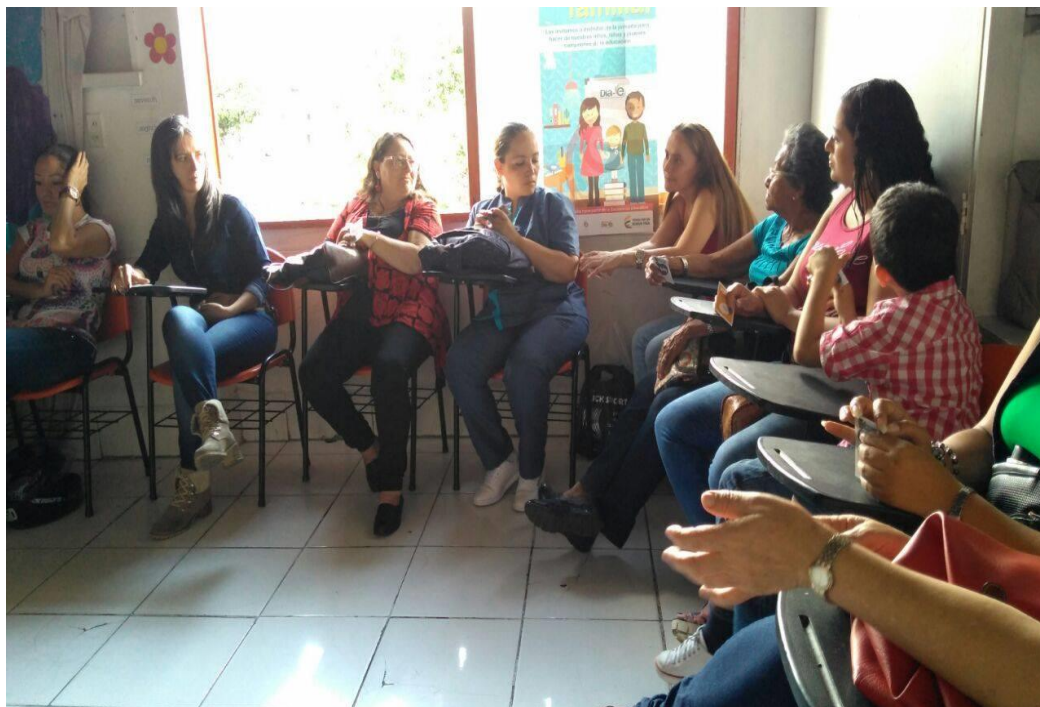
TALLER REFLEXIVO (junio-2017)