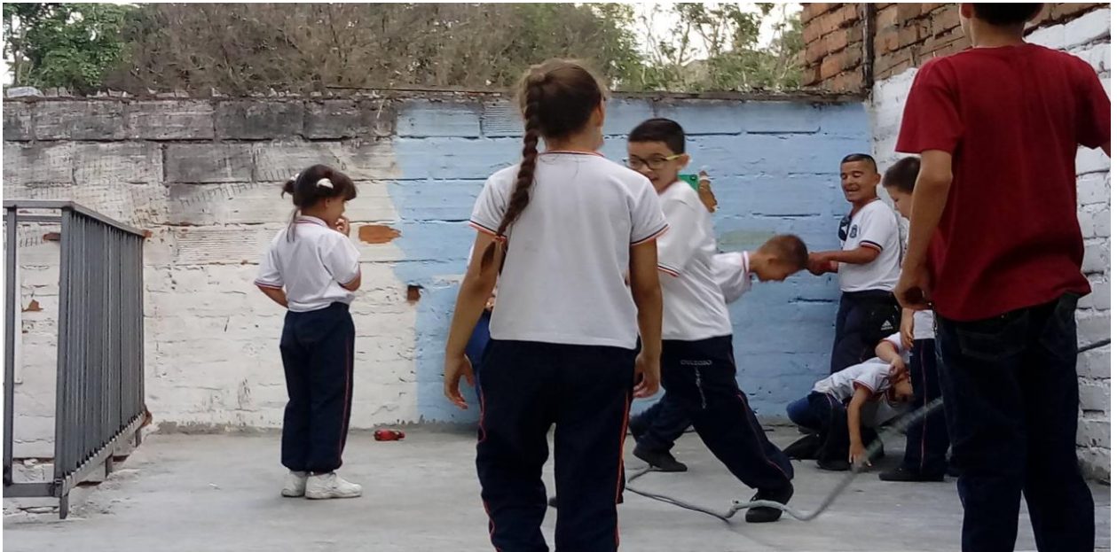
COMPARTO JUEGOS CON MIS COMPAÑEROS ( septiembre 2017)