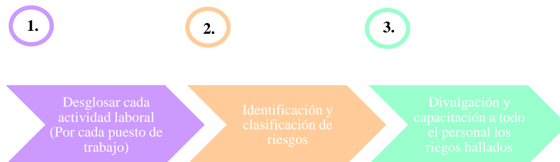
Figura 2. Pasos Matriz de Identificación de Peligros Evaluación y Control de Riesgos